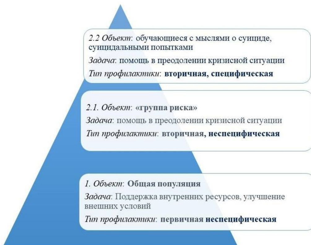
Рис. 1 Объект и задачи при разных типах профилактики

Upanne M., Hakanen J., Rautava M. Can suicide be prevented? The suicide project in Finland 1992-1996: Goals, Implementation and Evaluation, 1999.