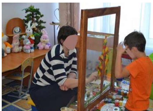
Рис. 4. Совместный рисунок с мамой «Осеннее дерево»