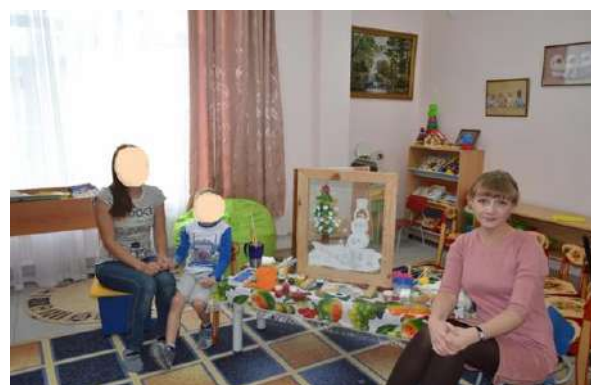
Рис. 3. Совместный рисунок с мамой «Зима пришла»