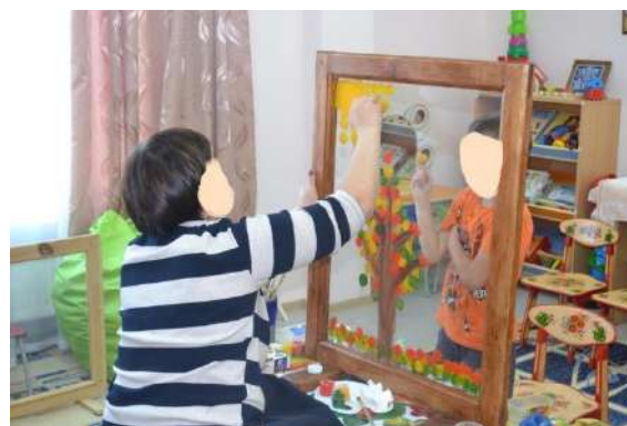
Рис. 5. Совместный рисунок с мамой «Осеннее дерево».

На данном занятии родитель смотрит на мир с позиции ребенка, отрывается от повседневных забот и вместе с ребенком создает продукт совместной творческой деятельности. В памяти через реальные действия закрепляется чувство «я могу понимать», «я могу принимать ребенка», «я могу чувствовать своего ребенка» и в итоге «я могу быть успешным родителем!». Результат совместной творческой деятельности – совместный рисунок – с разрешения родителей запечатлен на фото и видео. Пережитый позитивный опыт, с чувством «я могу быть успешным родителем», создает ресурс в памяти для дальнейшего воспитания ребенка и совершенствования своих родительских компетенций.