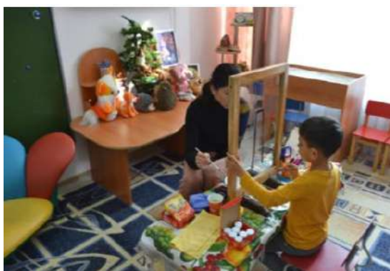
Рис. 2. Совместная творческая деятельность

Идея заключается в создании «прозрачных отношений» между ребенком и мамой. Пример совместной деятельности в рамках данного занятия см. рис. 2–5 1 .