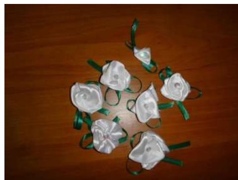
Рис. 7. Белые цветки, изготовленные участниками благотворительного проекта

В общей сложности в подготовленных мероприятиях приняли участие 83 человека из МБОУ гимназия № 161 (обучающиеся, педагоги, родители).