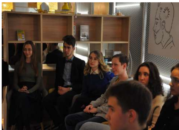
Рис. 9. Участники реализации проекта