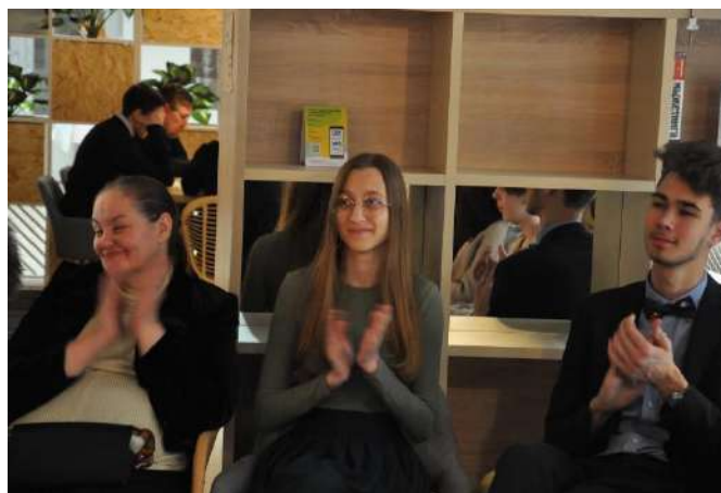
Рис. 10. Участники реализации проекта

Интересным и вполне закономерным результатом проведенных встреч является появление новых социальных контактов, начало дружеских отношений, в основе которых лежит общность интересов.