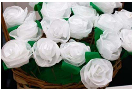
Рис. 6. Белые цветки, изготовленные участниками благотворительного проекта